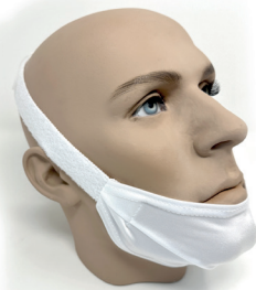
Toronto Weiß, Uni-Größe