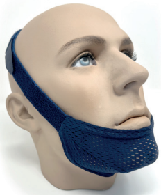
Ottawa mit Netzstoff, Navy Blau, Uni-Größe