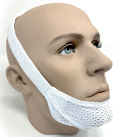
Québec mit Netzstoff, Weiß, Uni-Größe